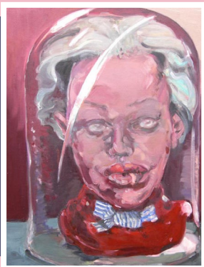
Der kleine Strolch

Artig sollst Du schreiten durch die Welt. Ein Schläfchen ist bestellt. Bis dass du madigmachst, was anderen gefällt.